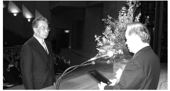
表彰式開催風景 イズミティ21大ホール

式典は、藤井黎仙台市長より本会管内から優良従業員表彰として12名、創業・創立記念表彰として12事業所がそれぞれ表彰された。また、表彰後には東北放送㈱の主任気象予報士斎藤恭紀氏を講師に迎え、「気象と経済～天気は景気を変えろ!?」と題した記念講演があり、盛会の内に終了した。