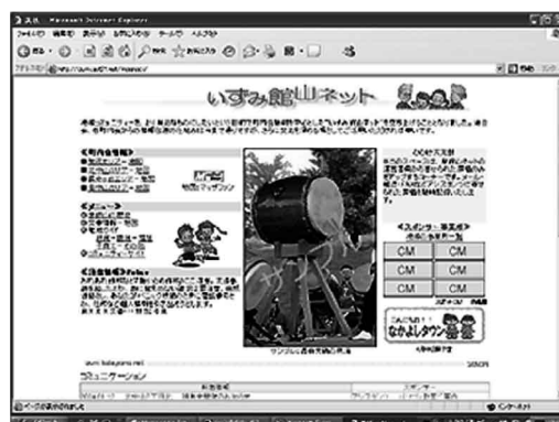
いずみ館山ネット トップページ

『いずみ館山ネット』ホームページアドレス http://www.e-mati.info/