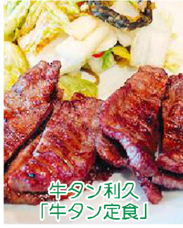
牛タン利久 「牛タン定食」