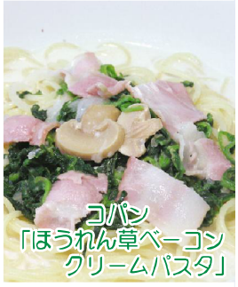
コパン 「ほうれん草ベーコン クリームパスタ」