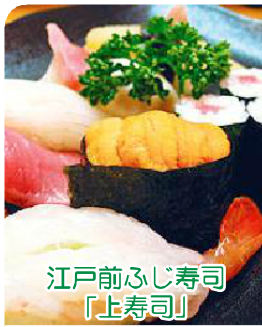
江戸前ふじ寿司 「上寿司」