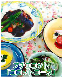
プチココット 「ココットコース」