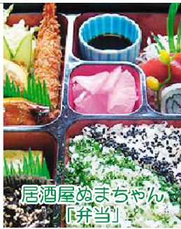
居酒屋ぬまちゃん 「弁当」