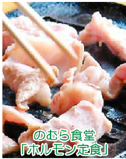
のぶら食堂 「ホルモン定食」