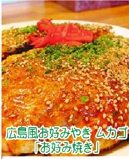
広島風お好み焼きムカゴ 「お好み焼き」