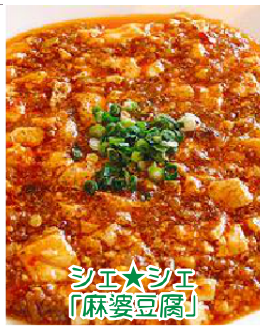
シエ★シエ 「麻婆豆腐」