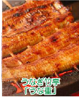
うなぎ竹亭 「うなぎ」