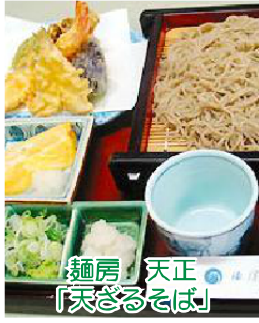
麺房 天正 「天ざるそば」