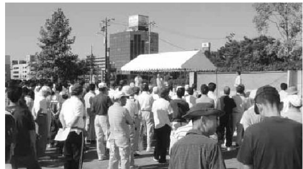
秋の一斉清掃開会式

仙台カップ国際ユースサッカー大会がユアテックスタジアム仙台を会場に開催されることに合わせ、「まち美化運動」として歩道のゴミやタバコの吸殻等を拾い、皆ゴミ袋をいっぱいにして美化推進に努めた。