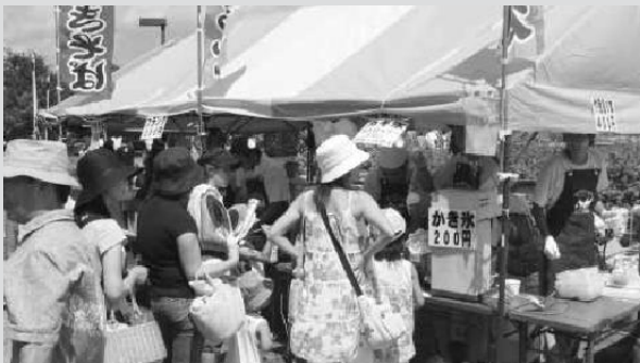
行列で大盛況だった青年部ビールまつりコーナー

また、宮城地区、秋保地区の青年部員にも協力して頂き、部員相互が協力し合って一致団結し、すべて完売することができ、まつりの盛り上げに協力することができた。