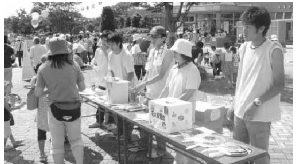
花火協賛募金の呼びかけ

また、日頃の交通安全意識の高揚を図るべく、本会泉地区役員と女性部員が中心となり、交通事故防止運動のチラシ等も配布した。今や泉区における夏の風物詩、祭りのフィナーレを飾る花火大会では、約5千発の大輪が打ち上げられ、泉の真夏の夜空を彩った。