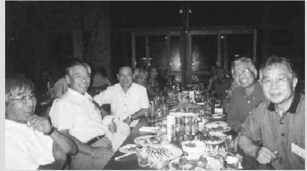
秋保支部ビアパーティー開催風景