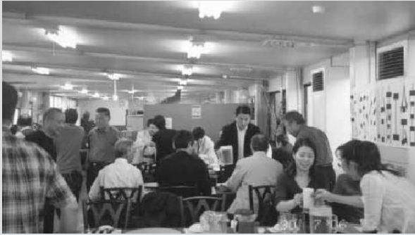
宮城地区4支部合同ビアパーティー開催風景

参加者は、約80名でアトラクションは、商工会員より協賛いただいた景品による抽選会を実施し、ホテルの豪華な食事券が当たった参加者から思わず高い歓声が上がり、レストラン内は最高潮に達し会員の親睦を深めた「サンディ」となった。