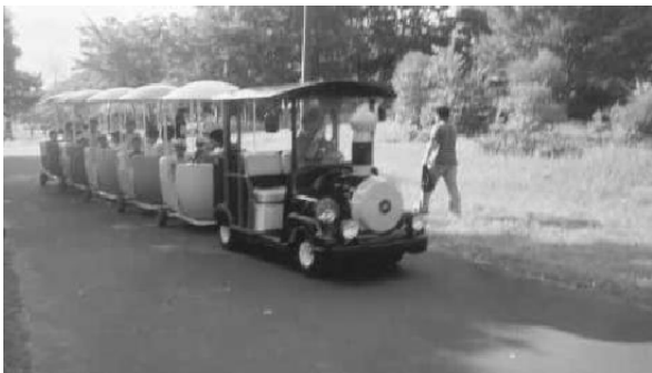
子供たちに人気だった「ポットレイン」

ステージコーナーでは、空手道演武やフラダンス、ヒップホップダンスなどが披露され、観客を魅了した。一方、お祭り広場での「アユのつかみ取りコーナー」、「ポニー乗馬コーナー」そして市民活動のPRの場となった「ふれあい広場コーナー」等も好評を博し、50店もの出店が並んだ「縁日コーナー」にも多くの人出で賑わった。