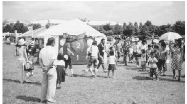
家族みんなで楽しめる「ふれあい広場コーナー」

また、日頃の交通安全意識の高揚を図るべく、本会泉地区役員と女性部員が中心となり、交通事故防止運動のチラシ等も配布した。今や泉区における夏の風物詩、祭りのフィナーレを飾る花火大会では、約5千発の大輪が打ち上げられ、泉の真夏の夜空を彩った。