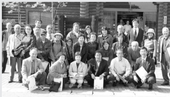
上の岱地熱発電所にて

当日は天候に恵まれ、参加者33名は車窓より鮮やかに紅葉した山間部を眺めながら視察先へと向かった。最初に地熱発電所PRセンターで地熱発電の説明後、発電所及び蒸気生産井を見学し、地熱発電のしくみや環境への配慮等について学び、参加者達は自然保護やエネルギーの有効活用を再認識させられた。