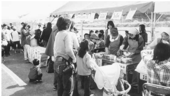
宮城地区農業まつり 女性部コーナーより

商工会は、青年部と女性部が出店し、青年部は昨年同様「焼きそば」「たこ焼き」の他に「くじ引き」コーナーを設けたところ、子供達に人気があり時折高い歓声で盛り上った。一方女性部は例年通り「うどん」「そば」を販売したところ午後2時頃に完売してしまうほど大評判で、大勢の来場者に手作りの美味しさが喜ばれ市民とのふれあいに花を添えることができた。