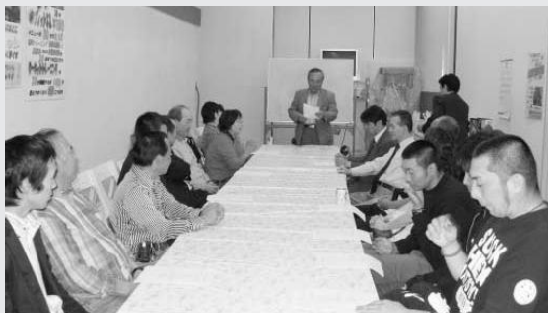
中央東支部ボウリング大会表彰式の様子

10月20日(金)、泉スカイボウルにおいて、中央東支部ボウリング大会が開催され、当日は昨年より少ない参加人数ではあったが、11月8日開催予定の17支部による支部対抗ボウリング大会に上位10名は参加出来るということで、熱気あふれるボウリング大会となりました。また、表彰式でも大いに盛り上がり、支部会員同士の親睦が深められました。