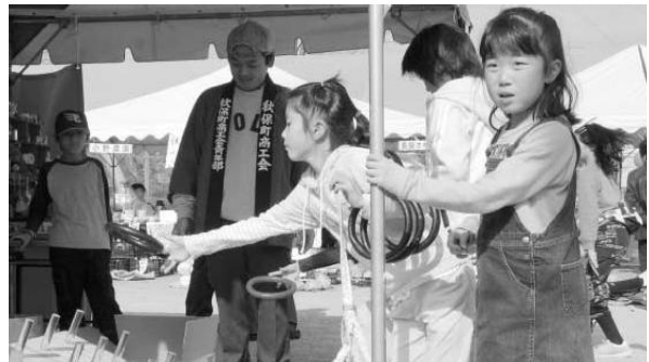
まつりだ秋保 青年部出店コーナーより

出店コーナーでは青年部が揚げたこ焼きや射的と縁日気分を盛り上げ、女性部はいなり寿司・だんご汁など、手作りのおいしい商品を提供し、地元の農産物や特産品を販売するテントが立ち並び、中央のステージでは、伝統芸能の発表や消防団のはしご乗り・大抽選会・創作太鼓などが披露され多くの来場者に喜ばれ、盛大に終了することができた。