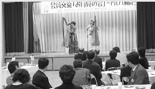
異業種交流会でのアルパ演奏

10月21日(土)、南光台コミュニティセンターにおいて(社)仙台北法人会泉第3支部と当会南光台、八乙女、黒松3支部共催による「異業種交流会 お月見の会」が開催された。南米の楽器「アルパ演奏」を聴きながらの交流会は、普段聞いたことのないアルパに耳を澄まし参加者を魅了することとなり、会員間の交流に一助できた交流会となった。