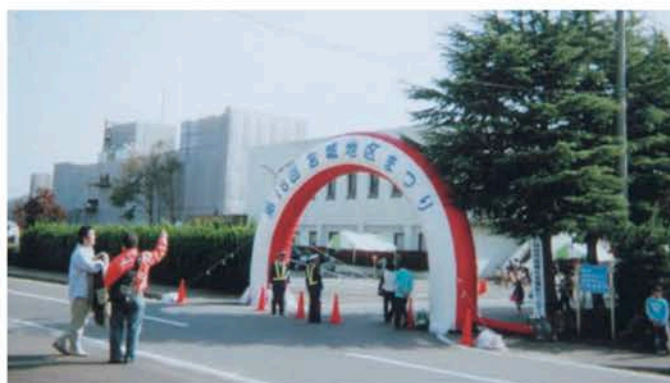
第31回まつりだ秋保