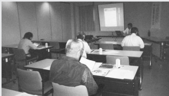
建設業部会講習会開催風景

今年度改正された点や、アスベスト除去について細心の注意が必要との説明をうけ、受講者は今後の安全管理の重要性を認識した講習会となった。