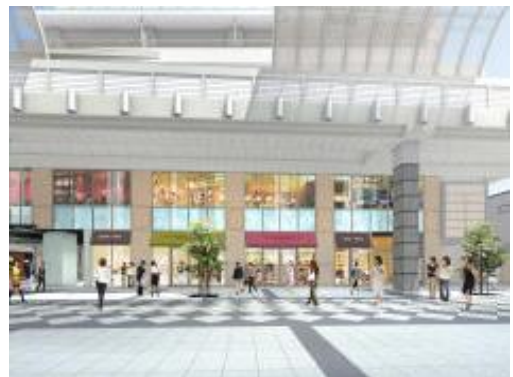
商業施設シリウス(イメージ)