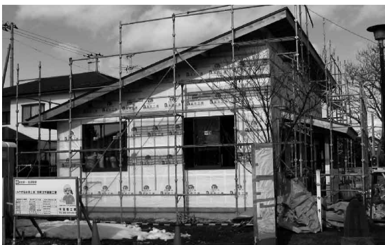
建設工事中の宮城支所会館 (1/27 撮影) (青葉区愛子東6-4-5)