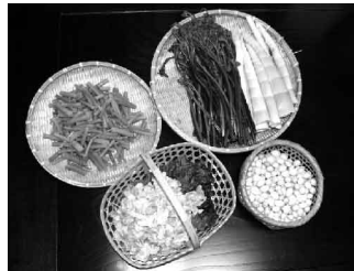
採れたばかりの新鮮な山菜