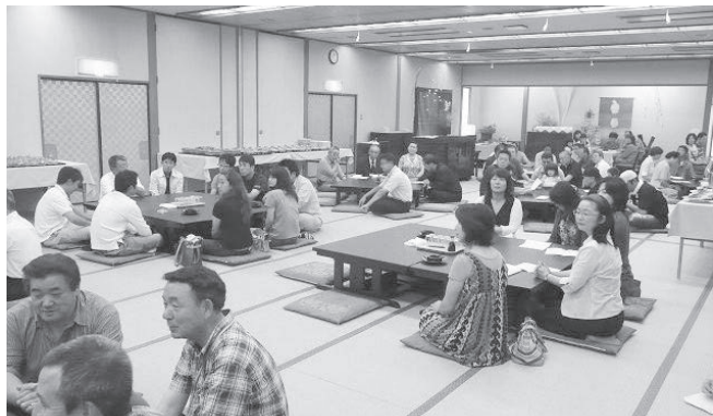
和気あいあいの合同ビアパーティー

7月22日(日)、湯の原ホテルを会場にひろせ西、ひろせ北、ひろせ、愛子の4支部合同のビアパーティーが開催された。和気あいあい楽しく一日を過ごし、支部間の垣根を越えて親睦を深めた。