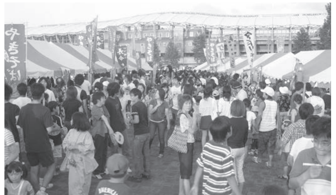
どの店も多くの人でいっぱい

まつりの主役と言えば今も昔もやはり「縁日！」。広い七北田公園には、商工会員の50張りのテントが3ブロックに分かれて焼き鳥やたこ焼き、ビールなどを販売し大いに区民まつりを盛り上げた。