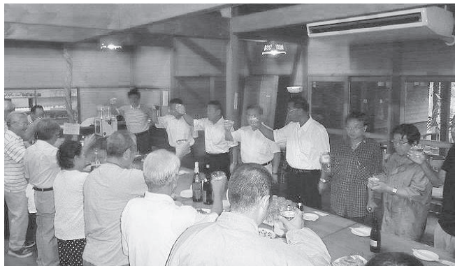
盛会に開催された親睦ビアパーティー

8月26日(日)、カフェ・ロシェを会場に秋保支部ビアパーティーが開催された。残暑の厳しい中多くの支部会員が参加し、夕べのひとつとき和やかに親睦と懇親を深め、盛況のうちに終了した。