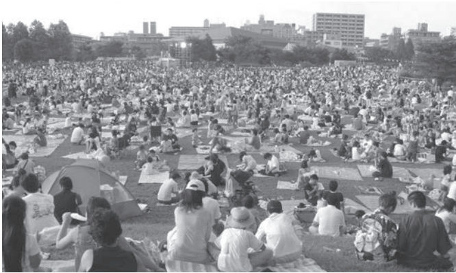
多くの来場者で賑った七北田公園

8月25日（土）、泉区夏の一大イベント、第27回泉区民ふるさとまつり（泉区民ふるさとまつり協賛会主催・会長佐藤浩商工会長）が七北田公園、泉中央駅ペDESTロリアンデッキを会場に開催された。今年も好天に恵まれ約17万5千人の人出で賑わった。