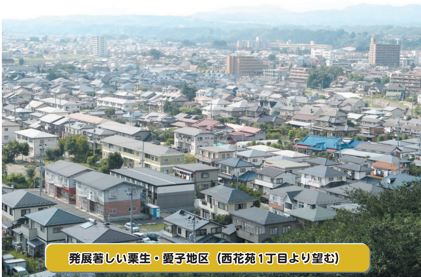
発展著しい栗生・愛子地区 (西花苑1丁目より望む)