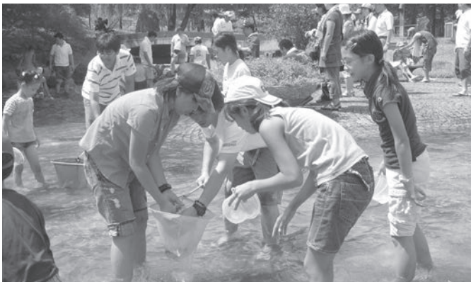
大好評だった「あゆのつかみどり」

ステージコーナーでは、福岡小学校の伝統芸能の獅子舞、民謡、ダンスなどが披露され、観客を魅了した。一方、お祭り広場での「アユのつかみ取り」、「白バイ乗車」コーナー等も多くの人で賑わった。また、「宮城地区」の特産品の販売も行われた。