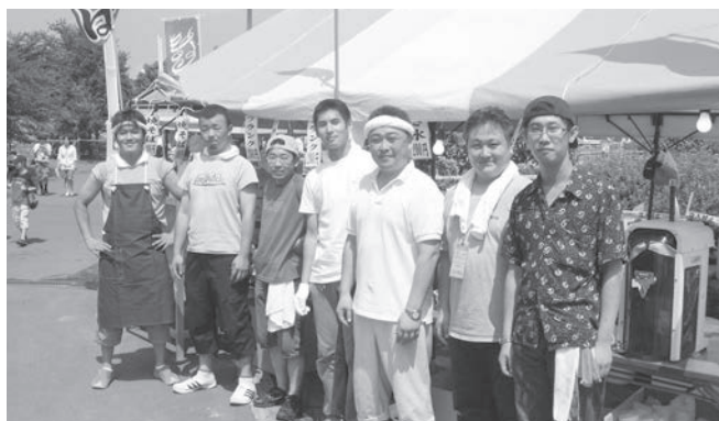
多くの人で盛況だった青年部コーナー

七北田公園で開催された第27回泉区民ふるさとまつり「ビールまつりコーナー」に出店し、ビール等を販売。宮城・秋保地区部員の協力も得て、部員相互の連携と団結に大いに結びつくまつり出店となった。