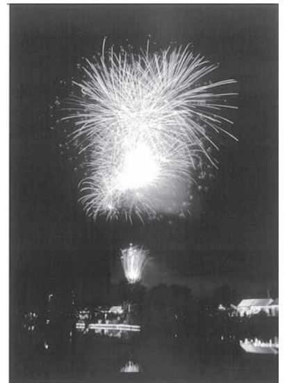
まつりの最後を飾る花火大会

花火打ち上げに、多大なるご協賛を頂きました各事業所等の皆様には、心より厚く感謝を申し上げます。来年も盛大に花火を打ち上げられますよう更なるご協力をお願い致します。