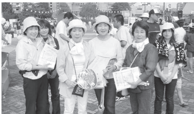
交通事故撲滅活動に参加した女性部員

ふるさとまつり会場で、今年も交通安全を呼びかけるチラシとポケットティッシュを配布した。この啓発活動が少しでも悲惨な交通事故の撲滅に役立つ様、参加した部員がまつり来場者に対して熱く訴えた。