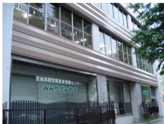
本町第3分庁舎 （定禅寺通側） ※正面入り口は この裏手です。