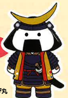
仙台・宮城観光PRキャラクター むすび丸