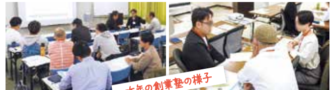
昨年の創業塾の様子

創業塾に参加して「この考え方は大切にしたいな」と思ったことがあります。それは「まずは自分が楽しむ」ことを大切にする、それからどうお客様に喜んでいただくか。開業間もなくは目の前のことをこなすので精一杯でしたが、少し余裕が出てきた今、この考え方は私を支えてくれています。 本当に参加して良かった と思える創業塾です。