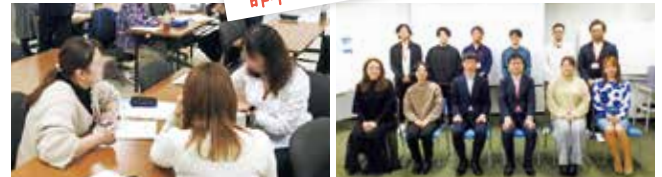
※プライバシー保護のため一部画像を加工しております